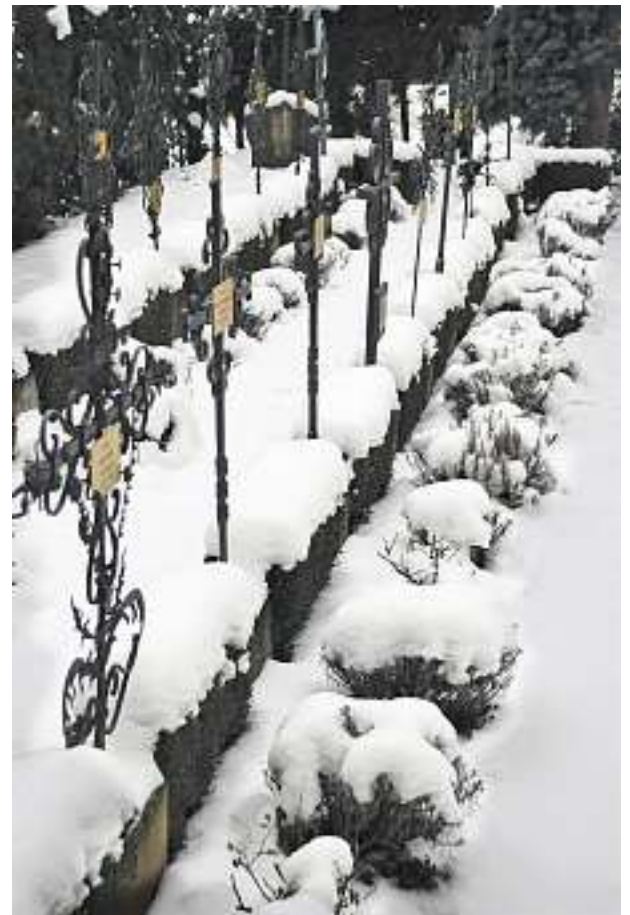
Kapuzinerfriedhof beim Kloster Dornach.