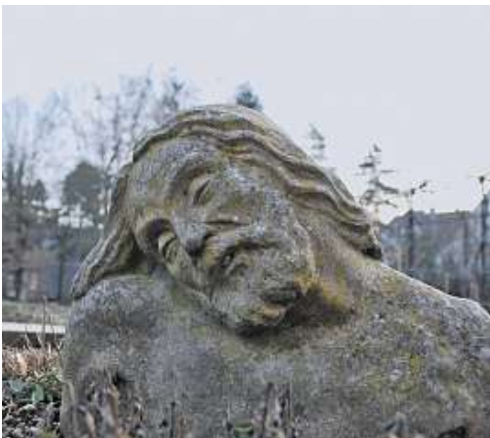
Der steinerne Christus im Klostersgarten