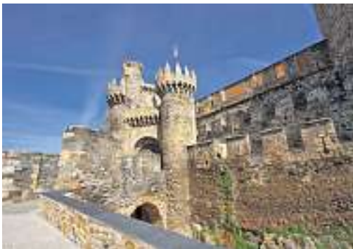
Die mittelalterliche Templerfestung in Ponferrada in Nordspanien.

Doch wer waren diese geheimnisvollen Tempelritter wirklich? Glaubenskrieger einer Ritter und Mönch vereinigenden Gemeinschaft, in der die Ideale einer christli-