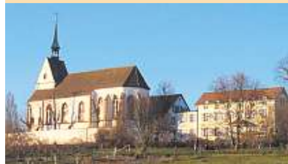
Wallfahrtskirche St. Chrischona.

Sekretariat Kloster Dornach, Postfach 100, 4143 Dornach, Tel. 061 701 12 72, info@klosterdornach.ch