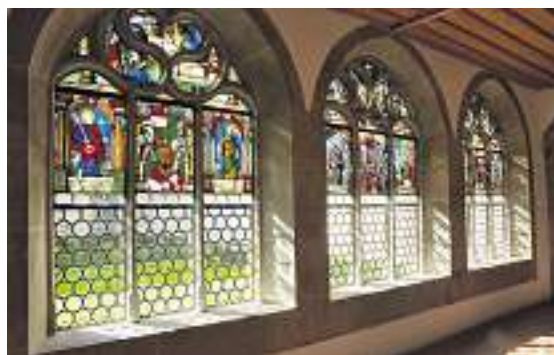
Glasfenster im Kloster Muri

Anmeldung: bis 6. September 2010 an: Gabriele Widmer, Unterer Zielweg 37, 4143 Dornach, 061 701 65 82, gabriele.widmer@bluewin.ch